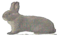
Marburger Feh .